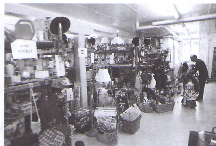
Im 2. OG: Brockenhaus Grünspan und PRAXAS / Soziale Dienst- leistungen

Im Dachgeschoss die Modelfirma DGM – am offiziellen Eröffnungstag war leider niemand anwesend.