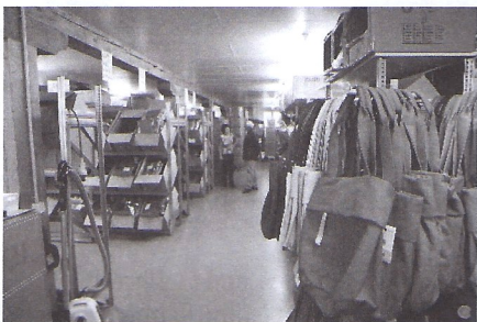
Im ersten OG: Taschen Gross – handel ZWEI (noch bis Ende 2014)