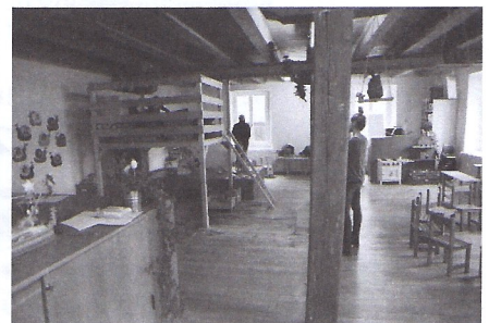
Auch im Parterre: Spielgruppe Schnäggehüsl