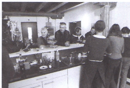
„Café Mühle“ und Empfang im Parterre